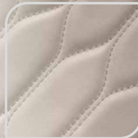
Tapicerka skórzana Lux w tonacji Cashmere bez dopłaty