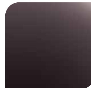
Ametista Scura 1 600,- lakier metalizowany specjalny