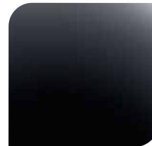
Mica Shadow Black bez dopłaty lakier specjalny