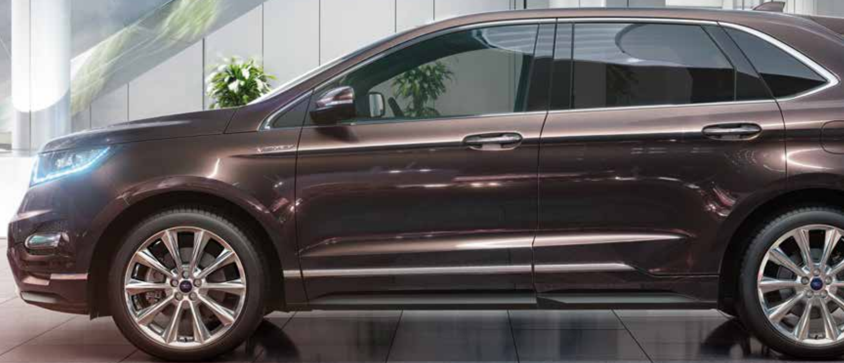
Ford Edge Vignale z 20" obręczami kół ze stopów lekkich bez dopłaty