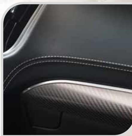
Obszyta skórą deska rozdzielcza standard