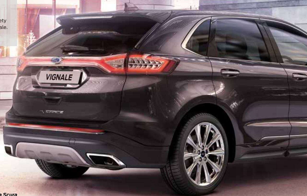
Ford Edge Vignale w kolorze Ametista Scura (opcja)

Ekskluzywny wygląd podkreśla unikalny kolor Ametista Scura - z palety zarezerwowanej tylko dla wersji Vignale.