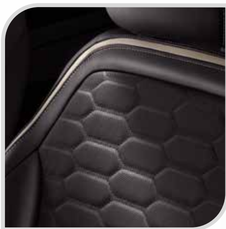
Tapicerka skórzana Lux w tonacji Charcoal Black bez dopłaty