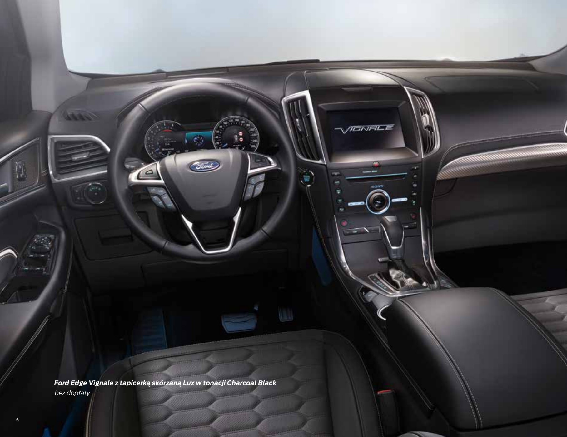
Ford Edge Vignale z tapicerką skórzaną Lux w tonacji Charcoal Black bez dopłaty