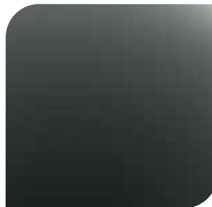
Magnetic Grey bez dopłaty lakier metalizowany